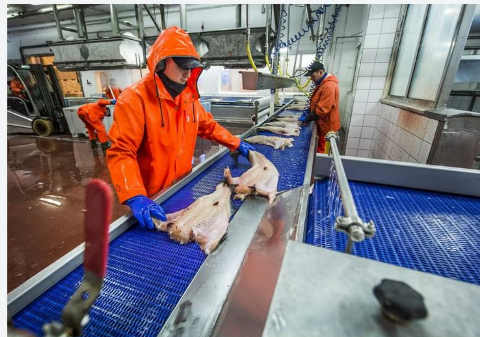
Mer enn annenhver fast ansatt i norsk fiskeindustri har utenlandsk bakgrunn. Vi har blitt stadig mer avhengige av arbeidsinnvandring - og mer sårbar. FOTO: STAAL WATTØ (ILLUSTRASJONSBILDE)