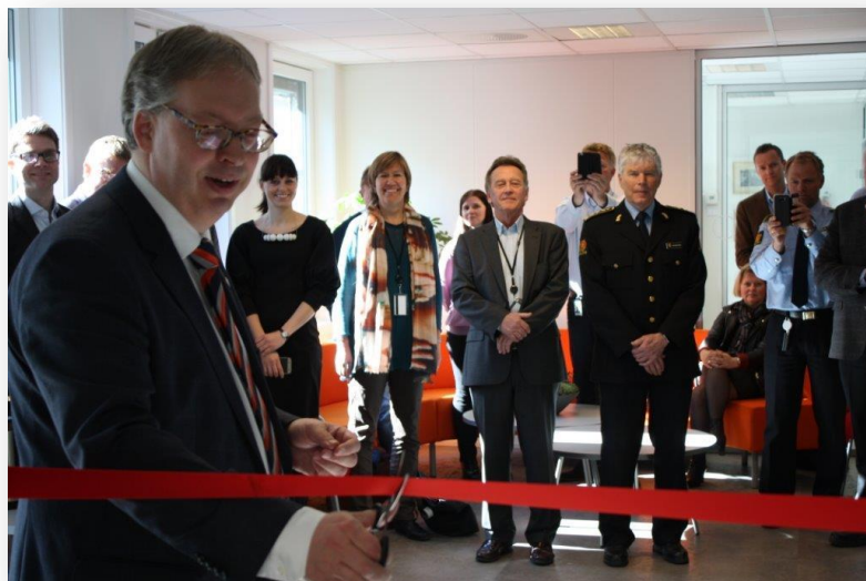
Åpning av samlokalisert senter i Trondheim