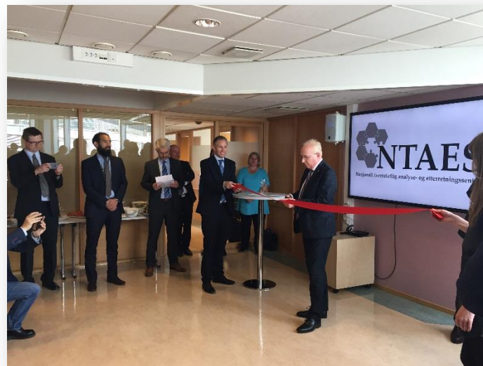
Åpning av Nasjonalt tverretattlig analyse- og etterretningssenter