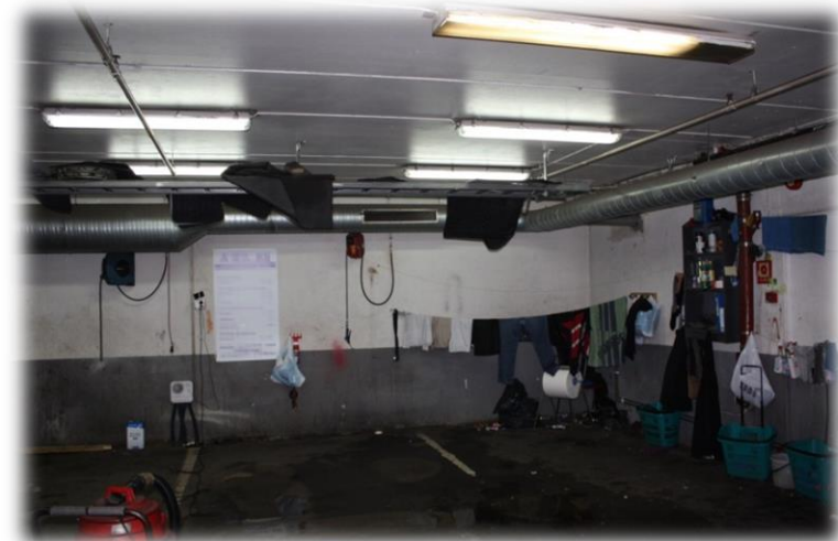
Garderobe i bilpleievirksomhet