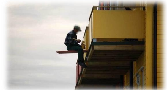
Usikret arbeid i høyden