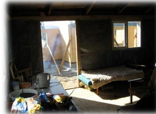
Innkvartering på byggeplass