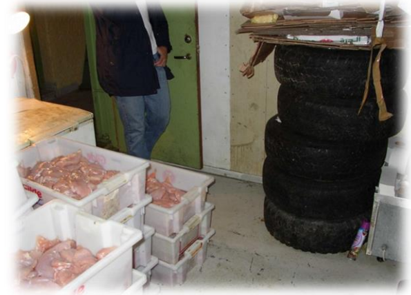
Fjørfekjøtt til marinering