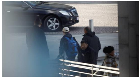
Denne gruppen venter på arbeid utenfor Oslo S.