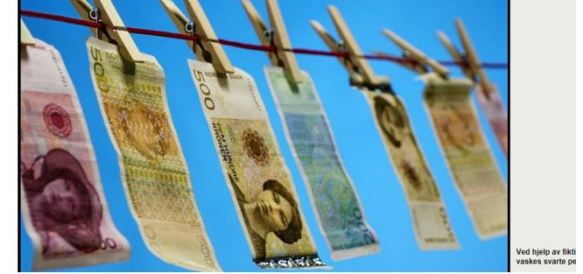
Ved hjelp av fikts svakere svarer på