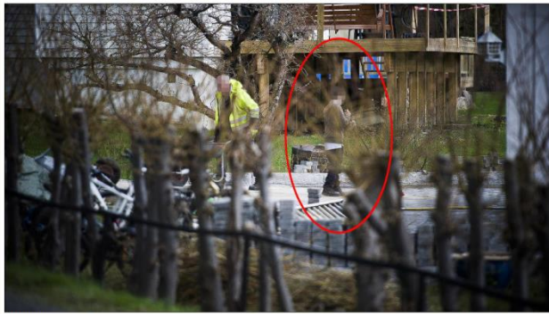
GUTTUNG: - Han er 12 år, sier faren om denne gutten som felet i en oppkjørsel i Bærum. Da faren og arbeidsløse ble oppmerksom på Dagbladet ble gutten sporenstrets kalt inn i en bil.