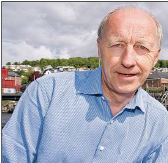
Måned for svart arbeid. Med dagens arbeidskraft og folk holder seg til svart arbeid, er det ikke vanskelig å se at det b

Skattevesen er utgjøre av tips. De må være kontrollert, og kontrollene må kunne gjøres ut til dem. Men som om de får til det, er ansettene av svart arbeid vanligvis å finne.