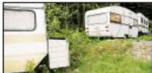
Det er i byggene i Oslo som er på det som er i Oslo. Det er i byggene i Oslo som er på det som er i Oslo.