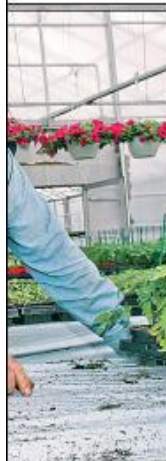
begge mennene har hatt det i Østlandet.